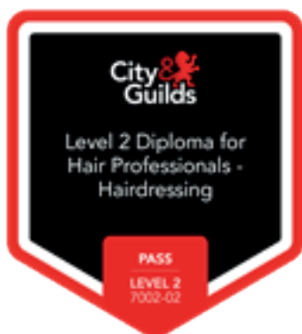
Otvorený odznak britskej organizácie City & Guilds