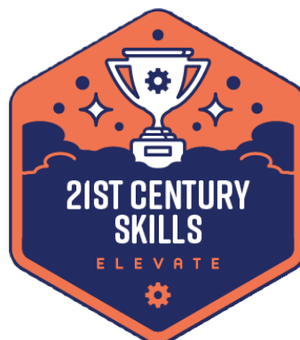
Otvorený odznak Bagdr University: Technológia: Úspechy v zručnostiach 21. storočia

Odznaky majú dva hlavné komponenty - obrázok a metadátové informácie. Obrázok je vizuálnym zobrazením o dosiahnutom výsledku zvolený jeho vydavateľom, často farebne alebo inak graficky odlišený na rozlíšenie stupňov náročnosti alebo iného progresu. Je to najviditeľnejšia časť odznaku, preto zvyčajne obsahuje informácie o jeho vydavateľovi alebo obsahu. Obrázky sú jednoduché alebo zložitejšie grafické prvky, ktoré si ich vydavatelia môžu navrhnuť podľa svojich potrieb alebo požiadaviek, napr. v súlade s vizuálnou identitou svojej inštitúcie. Návrhy takýchto obrázkov sú dostupné v grafických (platených aj voľne dostupných) online službách, ako je Canva, Freepik, Shutterstock 98 , ale aj priamo na vydavateľských platformách pre otvorené odznaky.